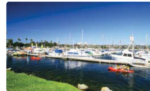
Campland on the Bay, Kalifornien

Furnace Creek im Death Valley). Folgende Internet-Seiten unterstützen Sie bei der Planung Ihrer Reise in den USA: www.recreation.gov , www.campingroadtrip.com und in Kanada www.pc.gc.ca .