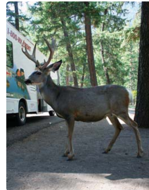
Wallowa Lake State Park, Oregon