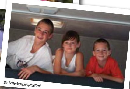
Die beste Aussicht genießen!