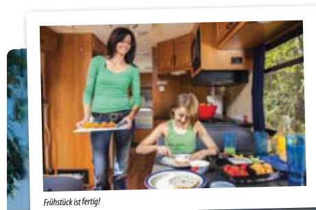
Frühstück ist fertig!

einplanen. Vielleicht genügt Ihnen schon der Blick auf den Grand Canyon vom Südrand, vielleicht machen Sie aber auch eine Tageswanderung in den Canyon hinein oder Sie buchen einen Hubschrauberrundflug, die Entscheidung liegt bei Ihnen! Im Grunde genommen werden Sie generell in den Nationalparks längere Stopps einplanen, als nur für eine Nacht, denn es gibt dort so viel zu entdecken und erleben und mit dem Wohnmobil haben Sie ja den Vorteil dass Sie innerhalb der Parks übernachten können. Einige Campinplätze auf unseren Routen sind nur