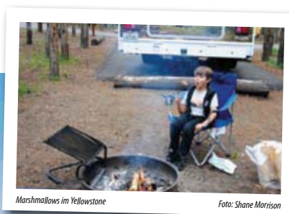
Marshmallows im Yellowstone

Kanada: Canada Day im Juli, Labour Day im September, Thanksgiving im Oktober – plus viele weitere Feiertage die nur in einzelnen Provinzen gelten.