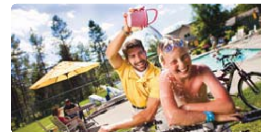
Orlando/Kissimmee KOA Campground, Florida