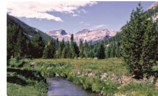
Shoshone River, Wyoming