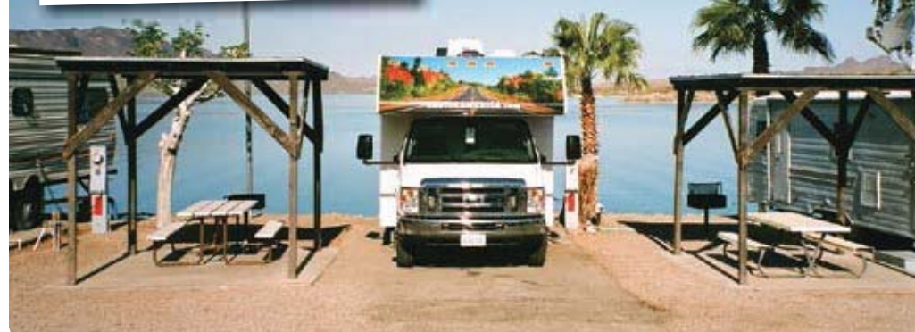
Lake Havasu, Arizona